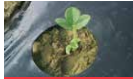
INIZIO FORMAZIONE DELLE NUOVE FOGLIE

Applicare in vivaio e/o 7-10 giorni dopo il trapianto ed eventualmente ripetere durante il ciclo di coltivazione.