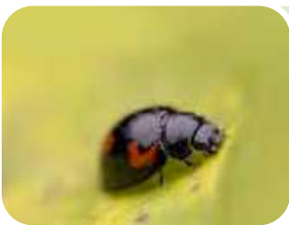
Exochomus quadripustulatus → COCCINIGLIE