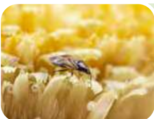
Orius laevigatus → TRIPIDI