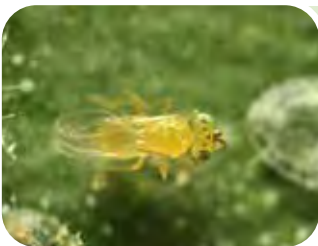
Eretmocerus eremicus → ALEURODIDI