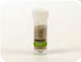
Ephestia kuehniella (uova sterili)