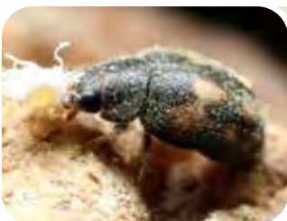
Nephus conjunctus → COCCINIGLIE